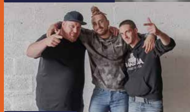
Bakoua Sound