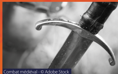
Combat médiéval