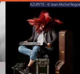
AZURYTE - © Jean-Michel Regoin